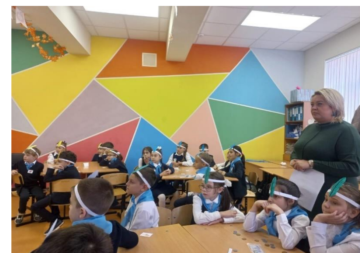
Деньги, дружба и... пословицы!